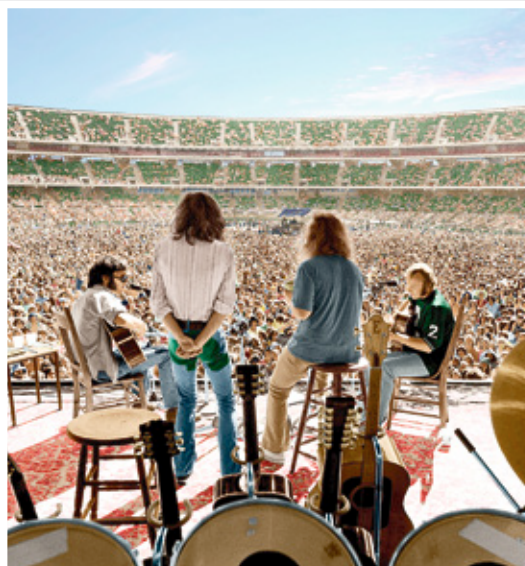
CROSBY, STILLS, NASH & YOUNG Povratak hipi kraljeva