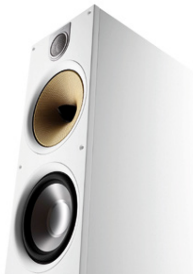
BOWERS & WILKINS 683 S2 Vrhunska tehnologija i tradicija

Cijevni USB DAC iz radionice Tim de Paravicinija